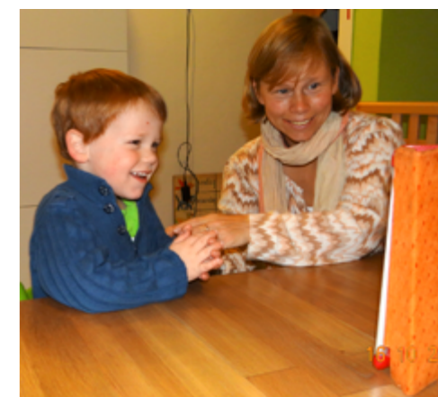
De kwaliteitscriteria en meer informatie zijn te vinden op de website: www.kwaliteitteletolk.nl