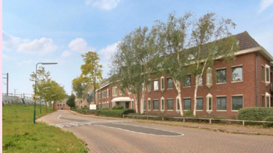
Randhoeve 221 in Houten, de nieuwe locatie van de belangenorganisaties voor doven en slechthorenden.

voorzieningen voor MG-doven, waarbij gebruik wordt gemaakt van de ervaringskennis van onze achterbannen. Zie ook p. 22.