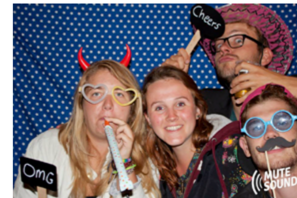
met dank aan Nimo Hersi

Daarnaast is het leuk om te weten dat we dicht bij het centrum wonen. Dat betekent makkelijk de stad in om te shoppen of om op stap te gaan. Verder zijn er natuurlijk restaurants, ideaal als je niet wil koken of niet thuis wil eten.