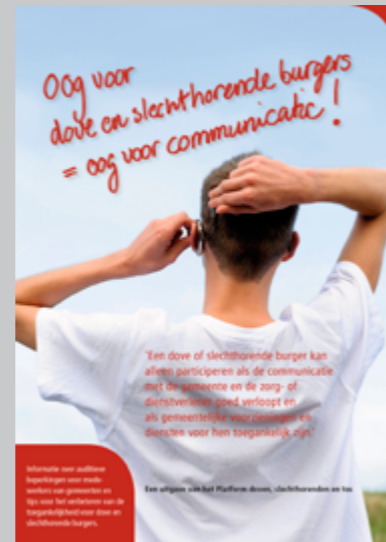
De belangenorganisaties maakten deze folder voor gemeenten, met veel informatie over doofheid en slechthorendheid in relatie tot de Wmo.