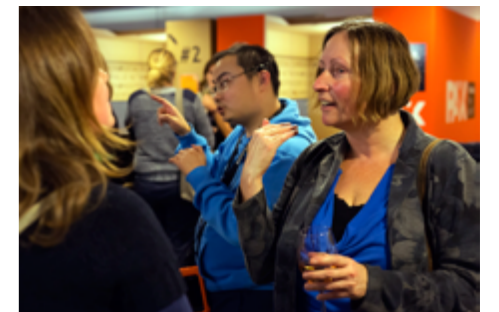
Grow2work eindejaarsborrel in Utrecht.